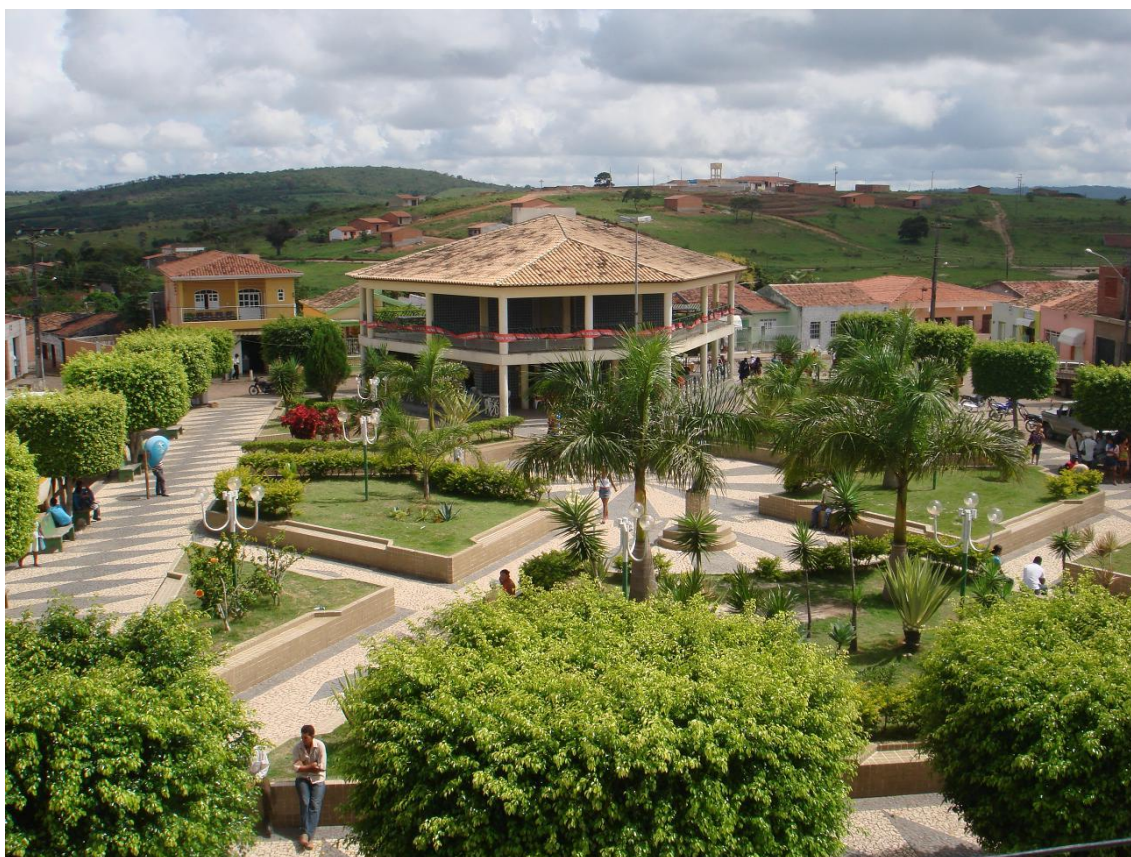
Figura 1 Vista da Praça Juracy Magalhães

Baseado nas necessidades específicas das pessoas com deficiência visual, toda área de circulação oferece grande risco a esse público como podemos ver na figura 1.