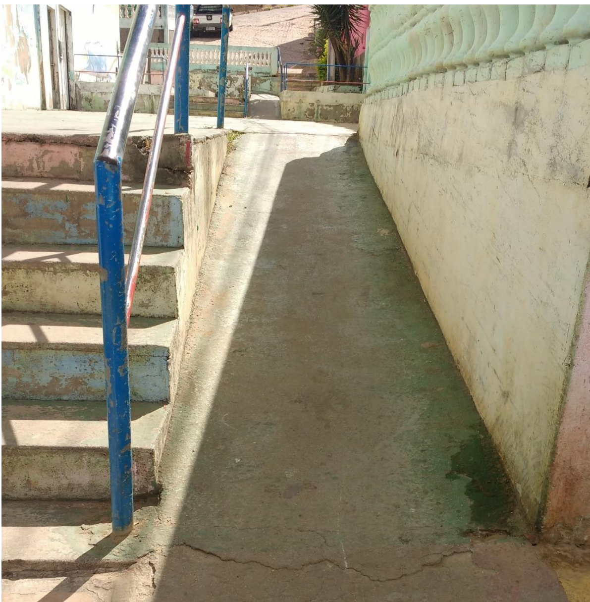
Figura 2 Rampa fora das normas no Playground Infantil Constantino