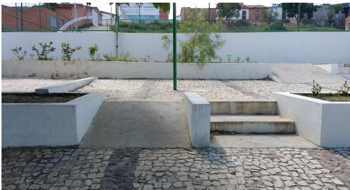
Figura 3 Rampa do parque infantil Jairo Tinel

Como podemos ver o escorregador não é acessível, e para chegar aos balanços e gangorras, existe rampa de acesso, porém antes de chegar nos brinquedos o chão é de brita o que dificulta a mobilidade. Não possui pista tátil, demonstrando não vislumbrar o deficiente visual. Neste sentido, amparado na lei 575008 referente aos “playgrounds” podemos afirmar que os dois espaços apresentados nesse trabalho destinados ao lazer das crianças não vigoram com o que diz a lei, e limita as possibilidades da criança com deficiência de usufruir de um dos direitos mais intrínsecos à condição da criança: o direito de brincar.