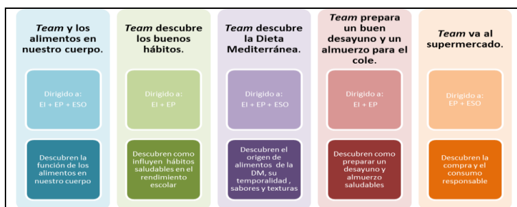
Imagen 1 Plataforma Team Consum

Para el lanzamiento y presentación de esta plataforma, tanto a profesores como a padres, se llevó a cabo una acción realizada en Noviembre de 2014 en el comedor del Colegio Purísima Concepción (Quart de Poblet, Valencia). Durante dos días, un equipo de Consum realizó un seguimiento para comprobar cómo era el consumo de fruta entre los niños de edades de educación infantil. En su primer análisis, comprobaron que el 40% de los niños no comió fruta en el momento del postre. Al siguiente día, en el mismo colegio y con los mismos niños, introdujeron la misma pieza de fruta pero con un packaging creado con la temática Team Consum en el que se les contaba la historia de un superhéroe que tenía una fuerza infinita al comer esa fruta. Dentro de la caja, estaba la pieza de fruta con una pequeña pegatina. Los niños jugaron con la caja y con la pegatina, pero todos comieron la fruta como postre. Bajo el lema, “Si les divierte, les interesa. Si les interesa, aprenden”, Consum demostró la importancia del juego como vehículo interlocutor entre el público infantil a la hora de introducirles valores educativos en cuanto a materia de alimentación se refiere. Es importante tener en cuenta también la participación del comunicador, docente o prescriptor. Aquel que les introduce la información a los alumnos/as y les anima a ser curiosos y a descubrir. En este caso es la chica que sale en el vídeo y les explica qué contiene la caja.