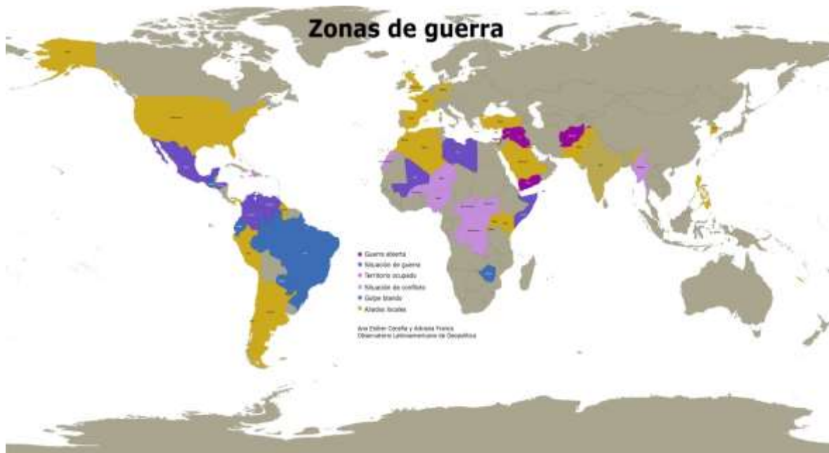
Mapa 1 Zonas de Guerra

No obstante, aunque esa es una pista que es necesario observar con cuidado por la complejidad que involucra, la ruta más evidente para establecer la lógica de las guerras o de los desplazamientos y expansión territoriales parece seguir el camino de los “recursos”, de las riquezas que brinda la naturaleza y que tienen su arraigo geográfico específico. Una revisión cuidadosa de las áreas en guerra o conflicto durante la última década muestra una puntual coincidencia con las rutas de la búsqueda de recursos, como puede observarse en los siguientes mapas.